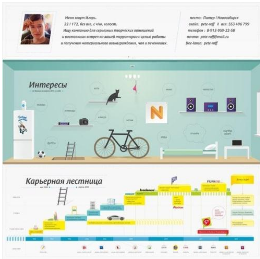
Рис.3. Пример лаконичного и содержательного резюме

Созданное автором резюме яркое и оригинальное, оно заставляет обратить на себя внимание. Неоспоримым преимуществом является его лаконичность, его можно уместить на одном листе бумаги. Однако, здесь автор сделал акцент по расположению и по цветовому оформлению на своих увлечениях, а не на опыте работы.